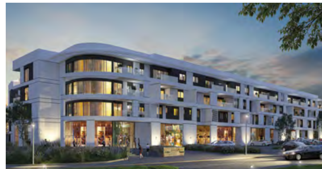
● קיסריה, CLE