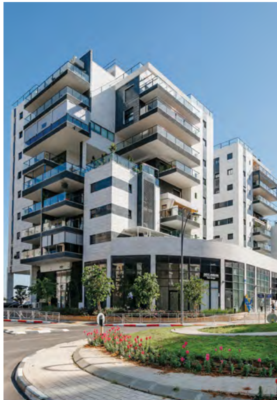
● UNIK BOUTIQUE, ראשון לציון