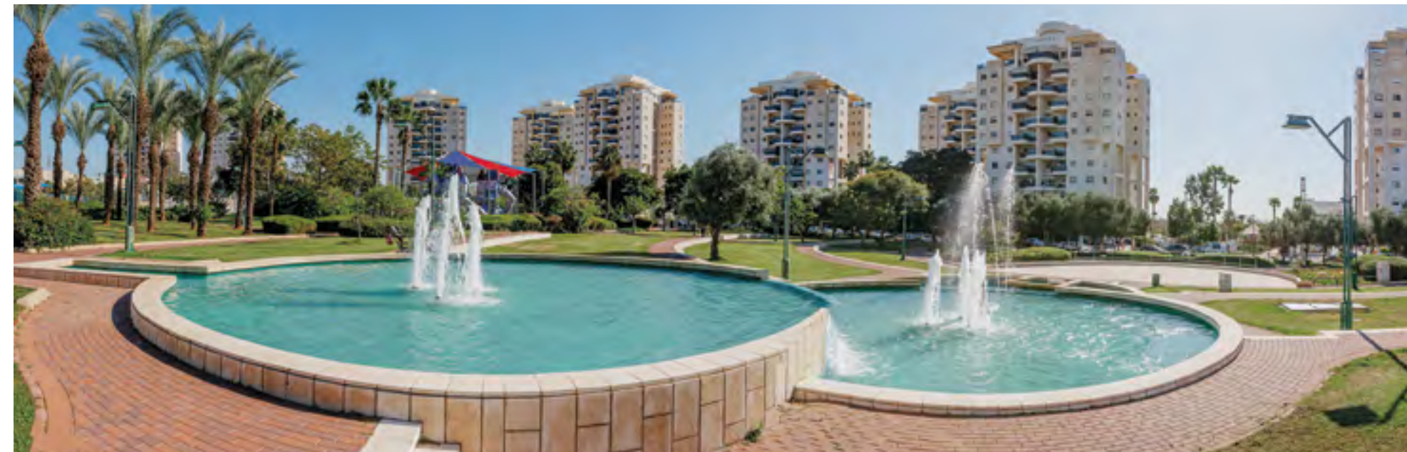
● חתני פרס נובל, ראשון לציון