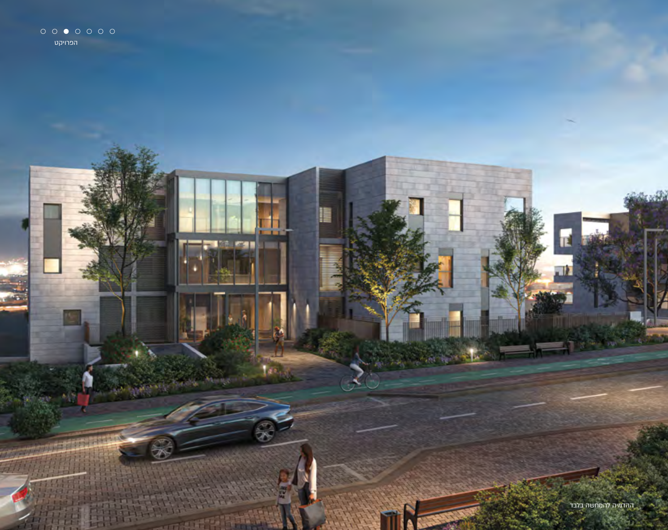
ההדמיה להמחשה בלבד