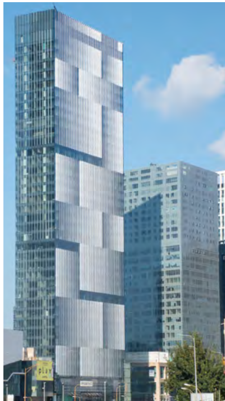
● עזריאלי טאון, תל אביב