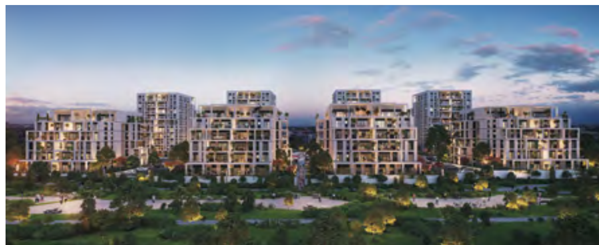
● BST אור ים, אור עקיבא