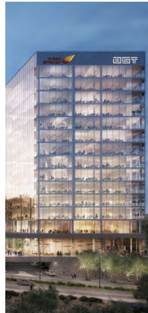
● PRIME, נוף הגליל