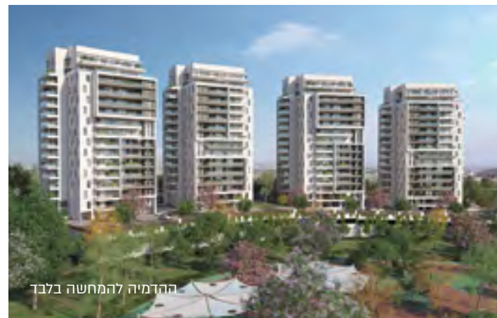
ההדמיה להמחשה בלבד

ארבעה בניינים בני 16 קומות, בעיצוב מודרני, במיקום אידיאלי בסמוך לפארק רחב ידיים. הבניינים כוללים לובי ראשי כפול המעוצב על ידי אדריכל פנים ומועדון דיירים. הדירות ייהנו ממרפסות שמש מרווחות עם מעקות זכוכית בשילוב אלומיניום, מעלית נוחה ומעוצבת ושוט אשפה. הבניינים מציעים מגוון דירות של 3-5 חדרים וכן פנטהאוזים מרשימים הצופים לנוף פתוח. בקומת הקרקע מתוכננים שטחים ירוקים המעוצבים על ידי משרד אדריכלות נוף מוביל.