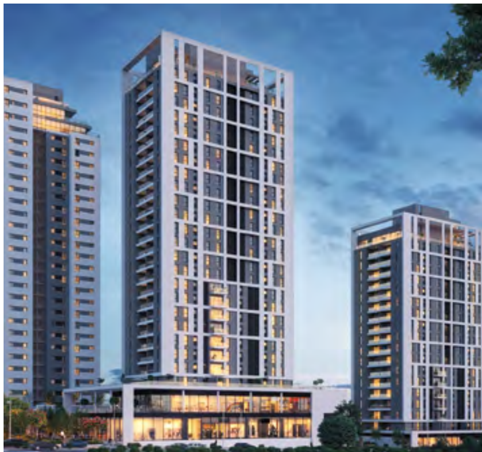
● הקריה האקדמית, פתח תקווה