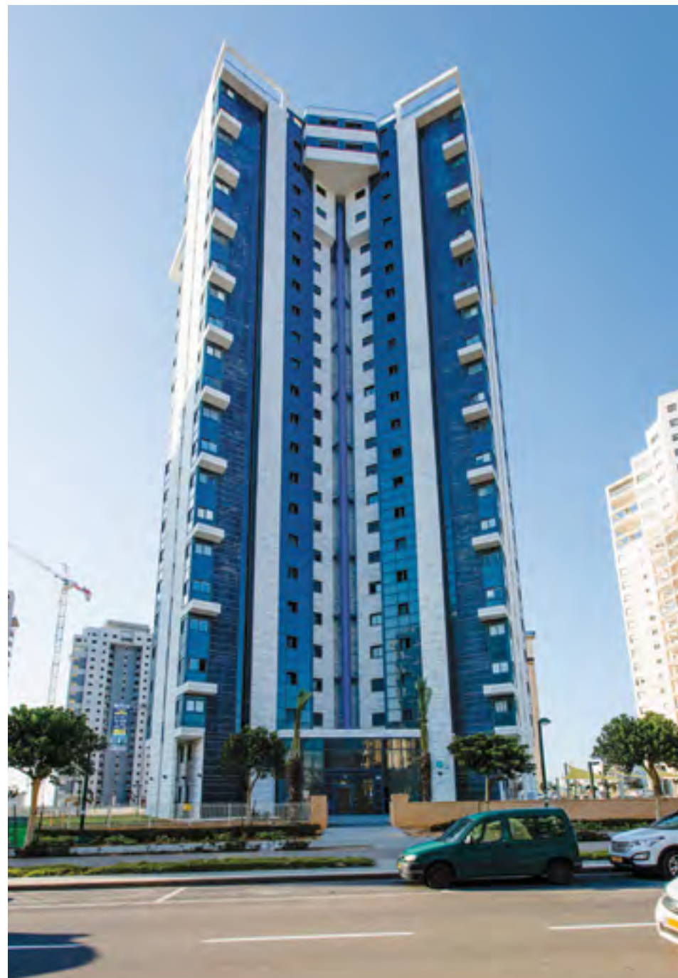
● SEE UNIK, נתניה