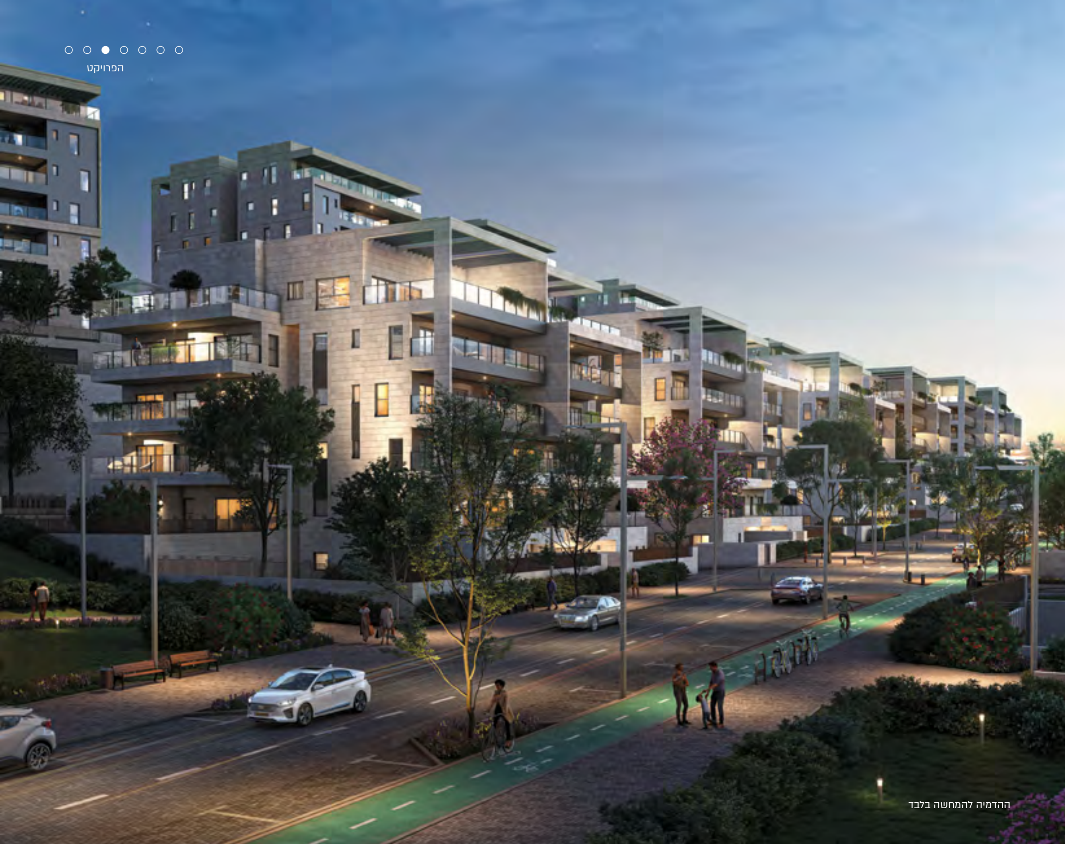
ההדמיה להמחשה בלבד