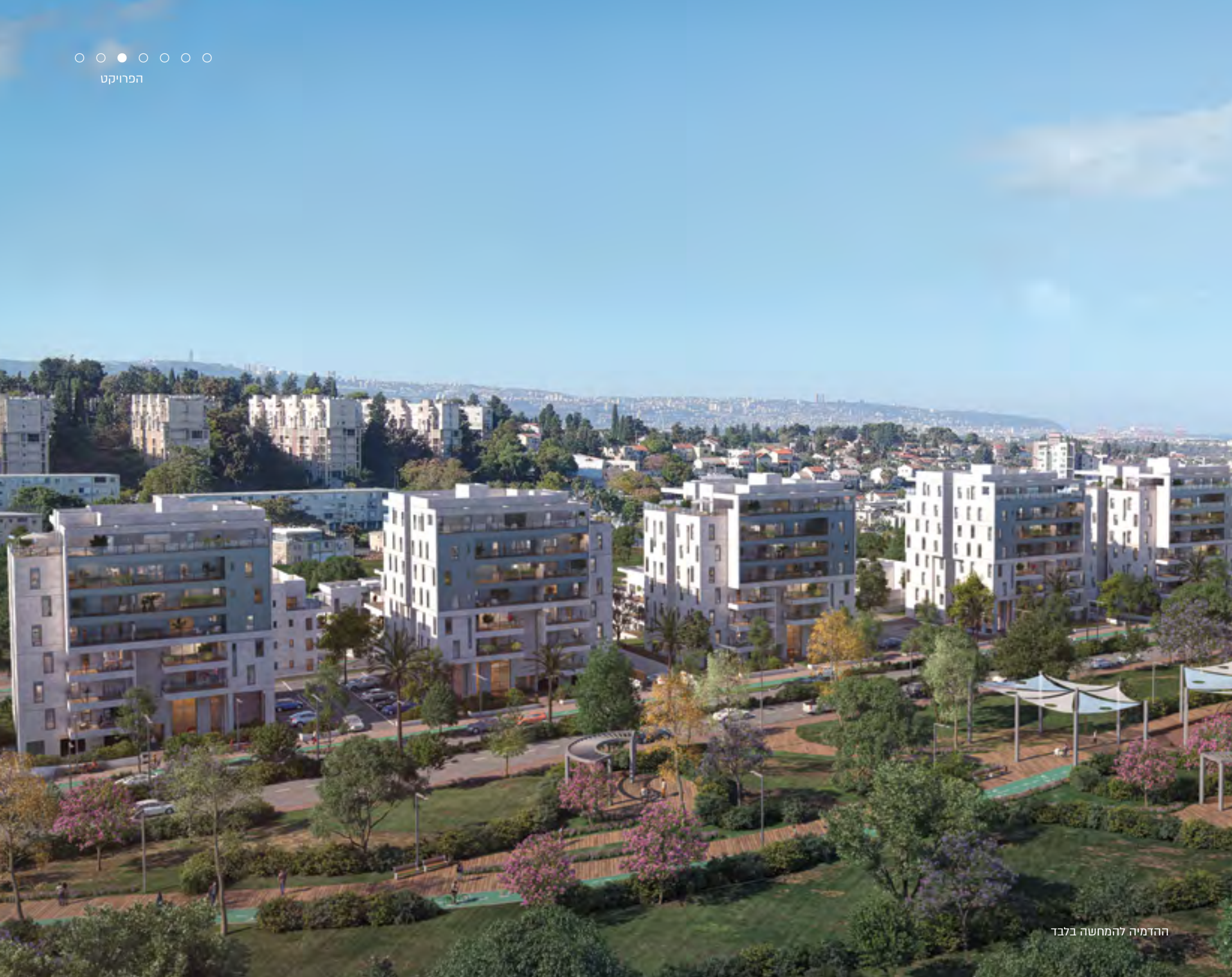
ההדמיה להמחשה בלבד