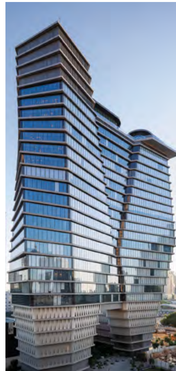
● TOHA, תל אביב