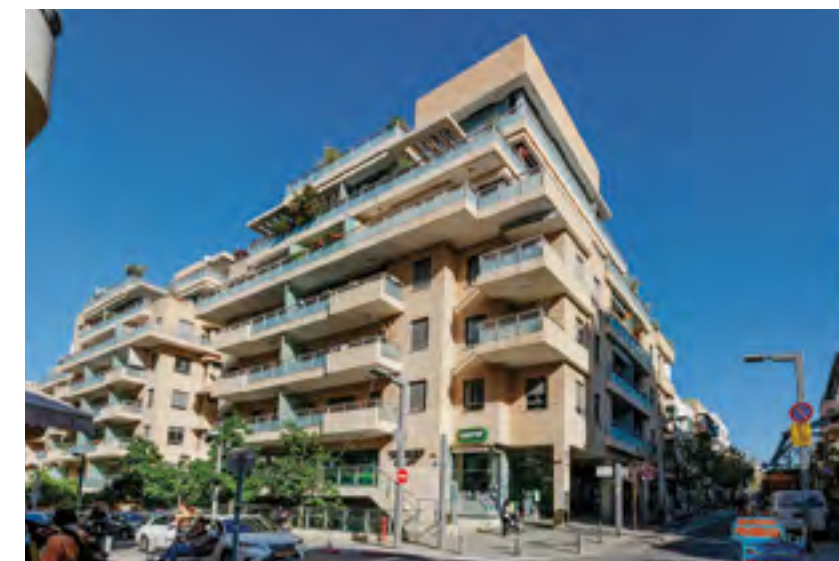
● מלצ'ט שינקין, תל אביב