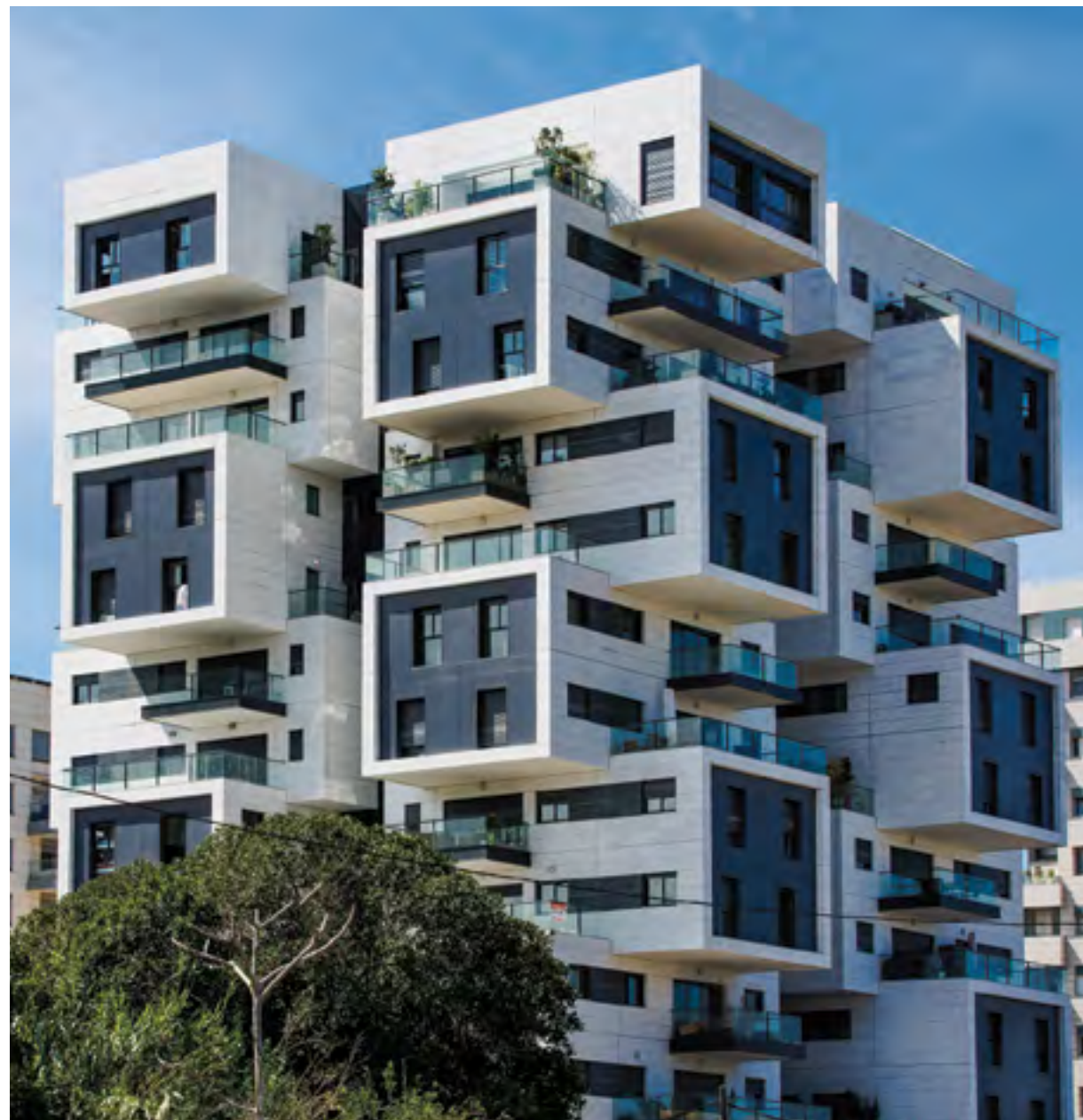
● BE UNIK, רמת השרון