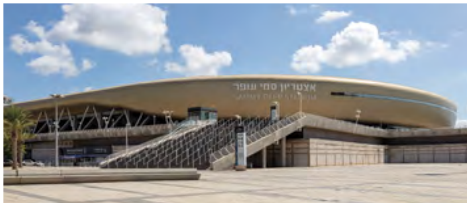
● האצטדיון הבינלאומי על שם סמי עופר, חיפה