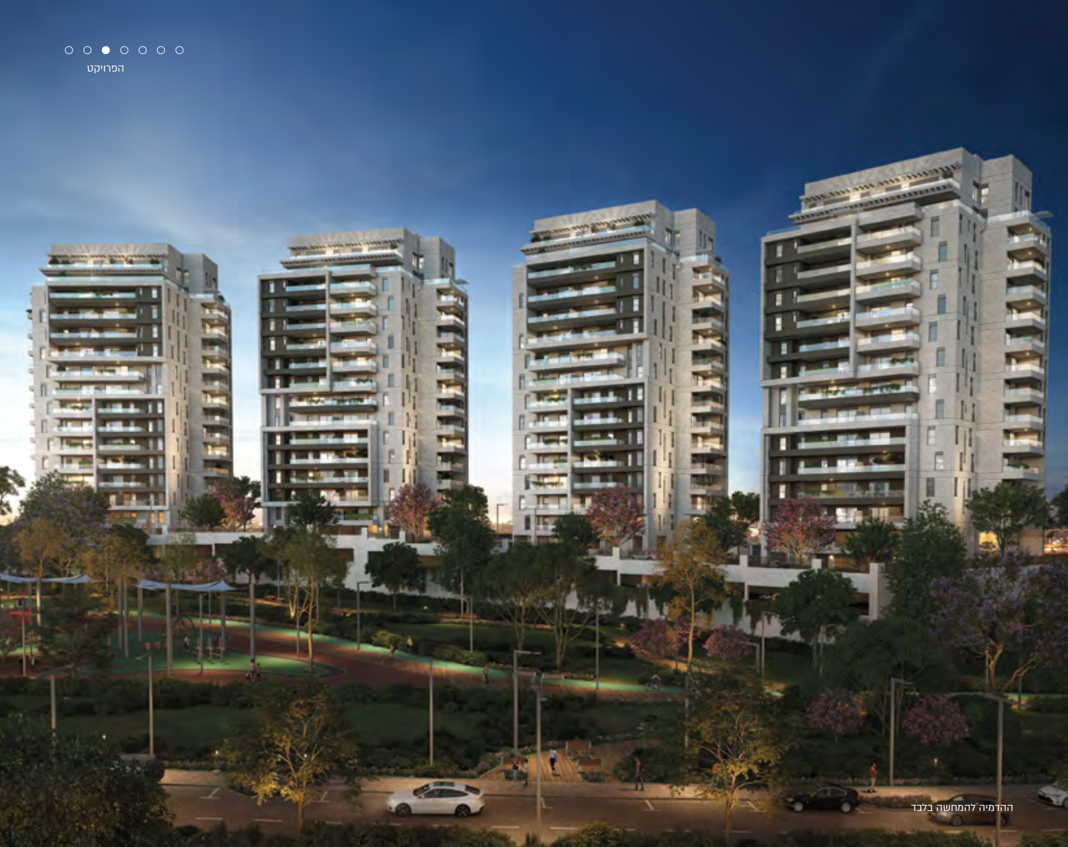
ההדמיה להמחשה בלבד