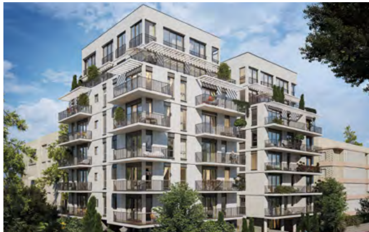
● אנטוקולסקי 6 ליליאן 10, תל אביב