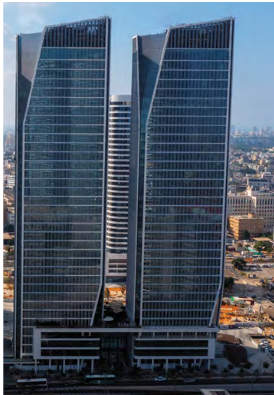
● תאומי רובינשטיין, תל אביב