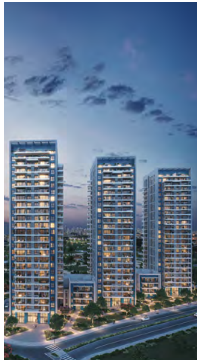
● NEXT TOWER, בת ים